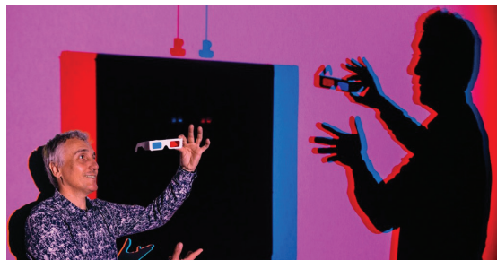
Installation Redshift 0.20, Malevitch Dialogue avec Takis du groupe Labofactory.

Instabilité absolue, avons-nous atteint le point d'inflexion ? déclame de façon répétitive la voix enregistrée d'une enfant dans l'espace sonore de l'installation Impressio , alors que d'autres voix récitent un poème sur l'empreinte, main de suie sur le mur, pied nu dans la boue, trace d'eau, enroulé de l'ADN. Trois autres narrateurs scandent atg tca ggc tct... la séquence du génome de l'Arabette des Dames, qui code la vision de la plante dans le rouge lointain. Ce code est écrit sur le monolithe noir au centre de la salle. À droite, huit monolithes identiques dessinent un rectangle et des rayons infrarouges filtrent entre les stèles et décodent la même séquence. À gauche, des plantes sont mises en culture sous une lumière bleue. Leur croissance résulte de l'expression du gène de la vision dans le rouge lointain. Cette installation est le rendu visible de la recherche collective du laboratoire de création, #2. Devenir plante : voir par le corps (architecture infrarouge), de l'atelier d'été biennal Useful Fictions initié par la Chaire arts & sciences en 2019, dont la seconde édition s'est déployée en 2021 à Poitiers, dans cinq lieux, en association avec l'Espace Mendès France et une dizaine de partenaires. Quatre autres laboratoires ; #1. À l'écoute du monde d'après ; #3. Tépalas, sépalas, pétales : croissance en états d'artificialité ; #4. Paysages immatériels Topologie